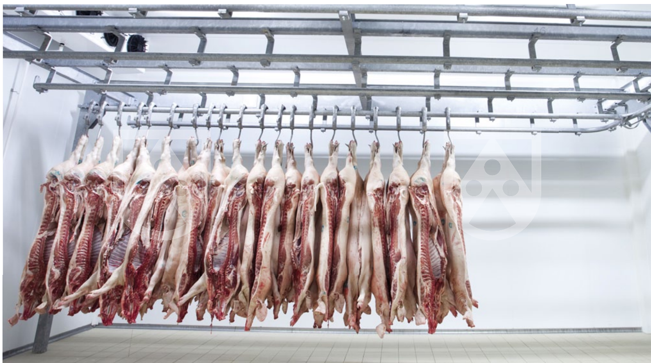
TroBloc® F Hygiene-Wandschutzplatten ermöglichen mit ihrem Easy-To-Clean-Effekt eine schnelle Reinigung großer Oberflächen.