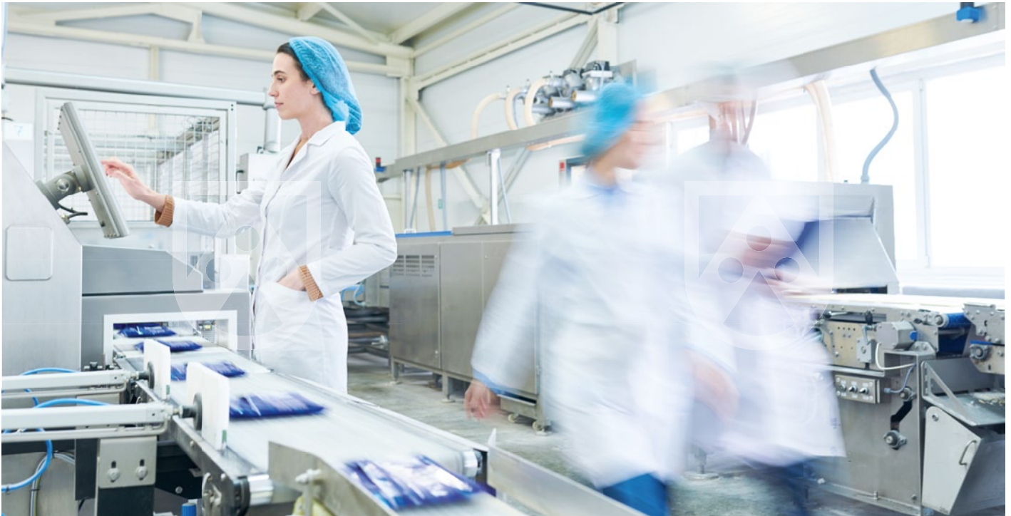
TroBloc® F Hygiene-Wandschutzplatten unterstützen Fachpersonal bei der Einhaltung der hohen Hygienestandards in der Lebensmittelindustrie.