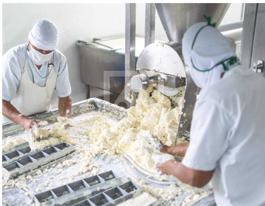
TroBloc® F Hygiene-Wandschutzplatten eignen sich für den Einsatz in zahlreichen Anwendungsbereichen.