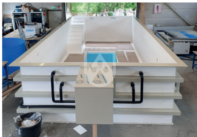
Swimmingpool in rechteckiger Ausführung mit Platten aus Polystone® P PG, Bild: Klees & Fröhlich GmbH