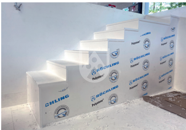
Treppe aus Polystone® P PG-Platten, Bild: Klees & Fröhlich GmbH