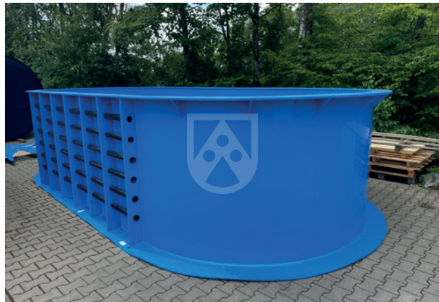
Swimmingpool in runder Ausführung aus Platten aus Polystone® P PG in Blau, Bild: Klees & Fröhlich GmbH