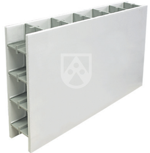
Polystone® P CubX® PG-UV stabilized white: Ermöglicht die Reduzierung von Stahlverstärkungen bis zu 100 %

Speziell für die Anforderungen im Poolbau haben wir Polystone® P CubX® PG-UV stabilized white entwickelt. Mit der weißen, UV-stabilisierten Deckplatte realisieren Sie optisch hochwertige Pools mit einer hohen UV-Beständigkeit und können je nach Konstruktion vollständig auf Stahlverstärkungen verzichten. Auch die von außen häufig angeschweißten PP-Verstärkungen können je nach Bauweise deutlich reduziert werden und die Bearbeitungszeit reduzieren.