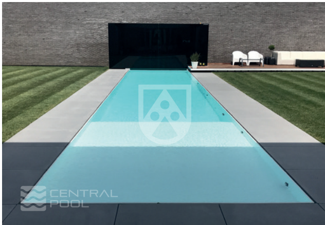
Swimmingpool mit Platten aus Polystone® P PGX, Bild: CENTRAL-POOL