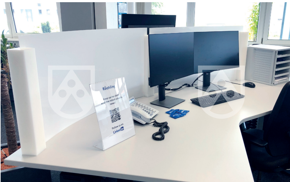
Spuck- und Niesschutz aus Sustarin® C: präventive Hygienemaßnahme für Ihre Teammitglieder

Zur Herstellung dieser Schutzwände werden verschiedene Materialien eingesetzt, die je nach Werkstoff Unterschiede bei der Reinigung, Optik oder Kratzfestigkeit haben können. Mit Platten aus unseren Markenwerkstoffen Sustarin® C (POM-C) , Foamlite® , Trovidur® ESA-D und Trovicel® stellen Sie sehr einfach langlebige und optisch hochwertige Trenn- und Spuckschutzwände her.