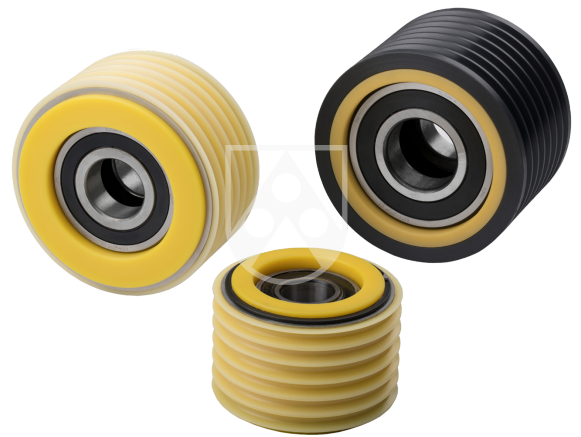
Die smarte Optamid® EasyFlex® für kunststoffummantelte Seile.

tor von Röchling Industrial Xanten. „Mit Entwicklung der Optamid® EasyFlex® bieten wir Aufzugsherstellern und dem Aufzugsservice eine zukunftsgerichtete attraktive Lösung an“.