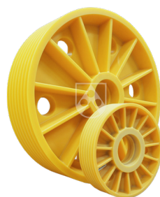
Optamid® Highrise für Aufzugsanlagen in Wolkenkratzern und im Schwerlastbereich